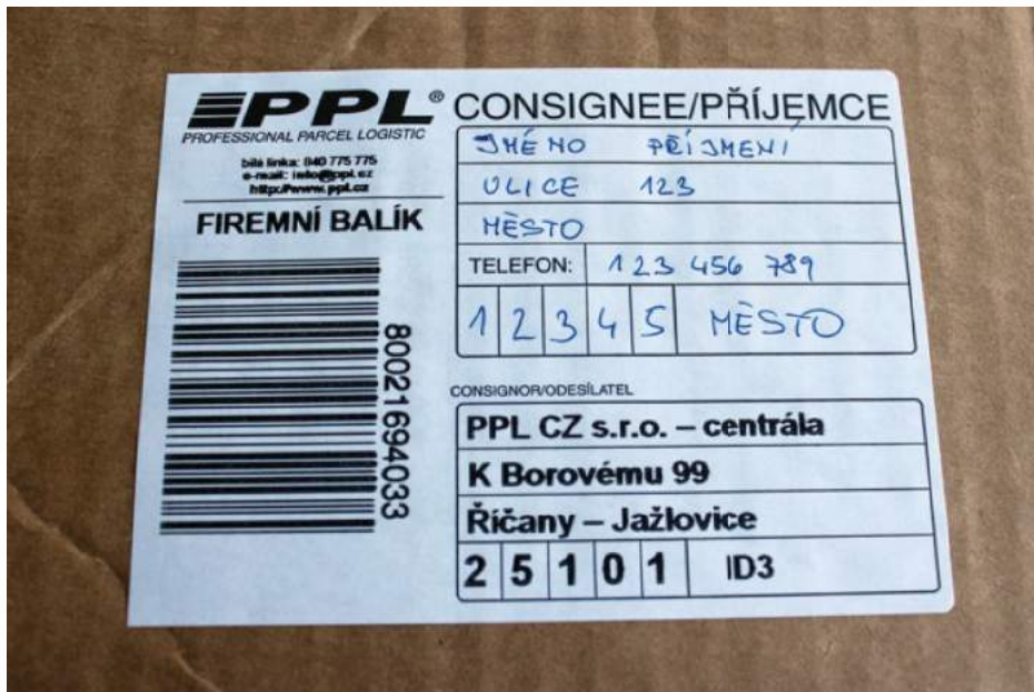
Fotografii adresního štítku přepravce