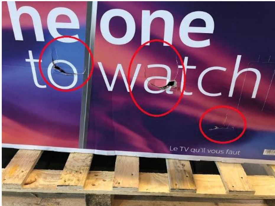
Fotografii poškození obalu